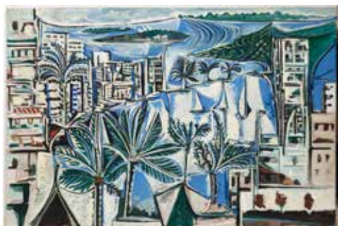
Pablo Picasso La Baie de Cannes Cannes, 19 avril 1958-9 juin 1958 Huile sur toile 130 x 195 cm Musée national Picasso-Paris Dation Pablo Picasso, 1979 © RMN-Grand Palais / Mathieu Rabeau © Succession Picasso 2019