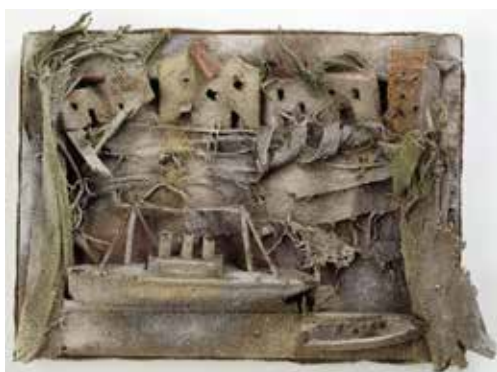
Pablo Picasso Paysage aux bateaux Juan-les-Pins, 28 août 1930 Sable teinté par endroits sur revers de toile et châssis, végétaux, carton, petits bateaux collés et cousus sur la toile 26 x 36 x 7,5 cm Musée national Picasso-Paris Dation Pablo Picasso, 1979 © Succession Picasso 2019