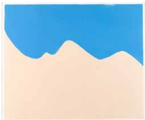
Pablo Picasso Faunes et chèvre Cannes, novembre 1959 Linoléum gravé à la gouge Premier plateau (ciel), 1 er état, deuxième plateau (paysage), 1 er état Épreuve sur papier 53 x 63,5 cm Musée national Picasso-Paris Dation Pablo Picasso, 1979 © Succession Picasso 2019