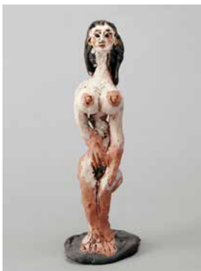
Pablo Picasso Femme nue debout Vallauris, 20 juillet 1950 Terre rouge modelée, décor aux engobes et incisions 17 x 5,8 x 6,2 cm Musée national Picasso-Paris Dation Pablo Picasso, 1979 © RMN-Grand Palais / Béatrice Hatala © Succession Picasso 2019