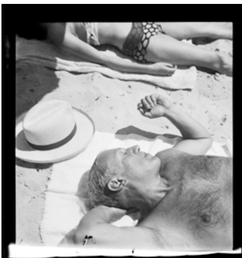
Dora Maar, Picasso, plage de Mougins , Centre Pompidou - Musée national d'art moderne © ADAGP, Paris © Centre Pompidou, MNAM-CCI, Dist. RMN-Grand Palais / image Centre Pompidou, MNAM-CCI © Succession Picasso 2019