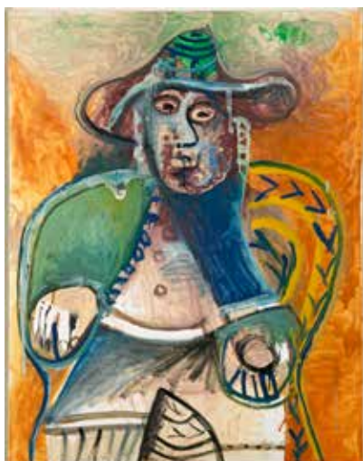
Pablo Picasso Vieil homme assis Mougins, 26 septembre 1970 - 14 novembre 1971 Huile sur toile 145,5 x 114 cm Musée national Picasso-Paris Dation Pablo Picasso, 1979