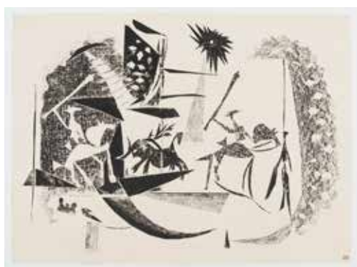
Pablo Picasso Corrida au soleil noir Paris, 7 janvier 1946 Crayon et encre sur papier lithographique découpé et collé, puis décalqué sur pierre Épreuve sur papier, tirée par Mourlot 32,8 x 49 cm Musée national Picasso-Paris Dation Pablo Picasso, 1979 © Succession Picasso 2019