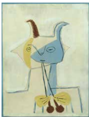
Pablo Picasso (d'après) Plaqué rectangulaire décorée d'un faune musicien [1948] Terre blanche, décor aux engobes 35,3 x 27 cm Musée national Picasso-Paris Dation Pablo Picasso, 1979 © Succession Picasso 2019