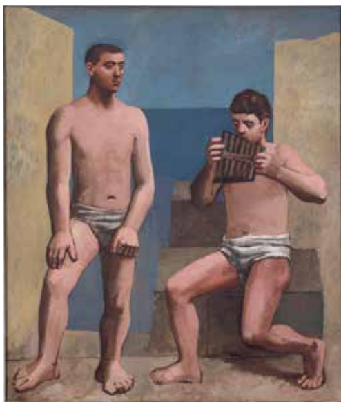
Pablo Picasso La Flûte de Pan Antibes, été 1923 Huile sur toile 205 x 174 cm Musée national Picasso-Paris Dation Pablo Picasso, 1979 © RMN-Grand Palais / Adrien Didierjean © Succession Picasso 2019

Contact : Christine Pinault/ cpinault@picasso.fr