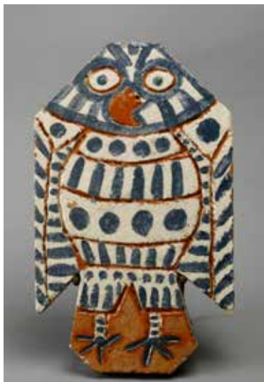
Pablo Picasso Tomette découpée et décorée en forme de chouette Cannes-Vallauris, 16 mars 1957 Terre rouge chamottée, décor aux engobes et incisions 33,5 x 20 x 4 cm Musée national Picasso-Paris Dation Pablo Picasso, 1979 © RMN-Grand Palais / Béatrice Hatala © Succession Picasso 2019