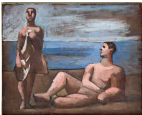
Pablo Picasso Deux Baigneurs 1921 Huile sur toile 33 x 41 cm Musée national Picasso-Paris Dation Jacqueline Picasso, 1990 © Succession Picasso 2019