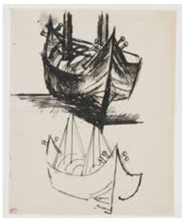
Pablo Picasso Études de barque [Cadaquès], [été 1910] Encre sur papier 22,6 x 17,4 cm Musée national Picasso-Paris Dation Pablo Picasso, 1979 © Succession Picasso 2019