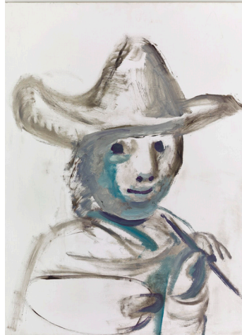
Picasso, Le Jeune Peintre, 1972, Huile sur toile